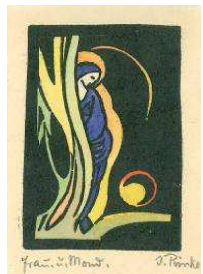
Frau und Mond, Farbholzschnitt

Wichtige Werke Prinke's wurden in den Wirren des Krieges vernichtet.