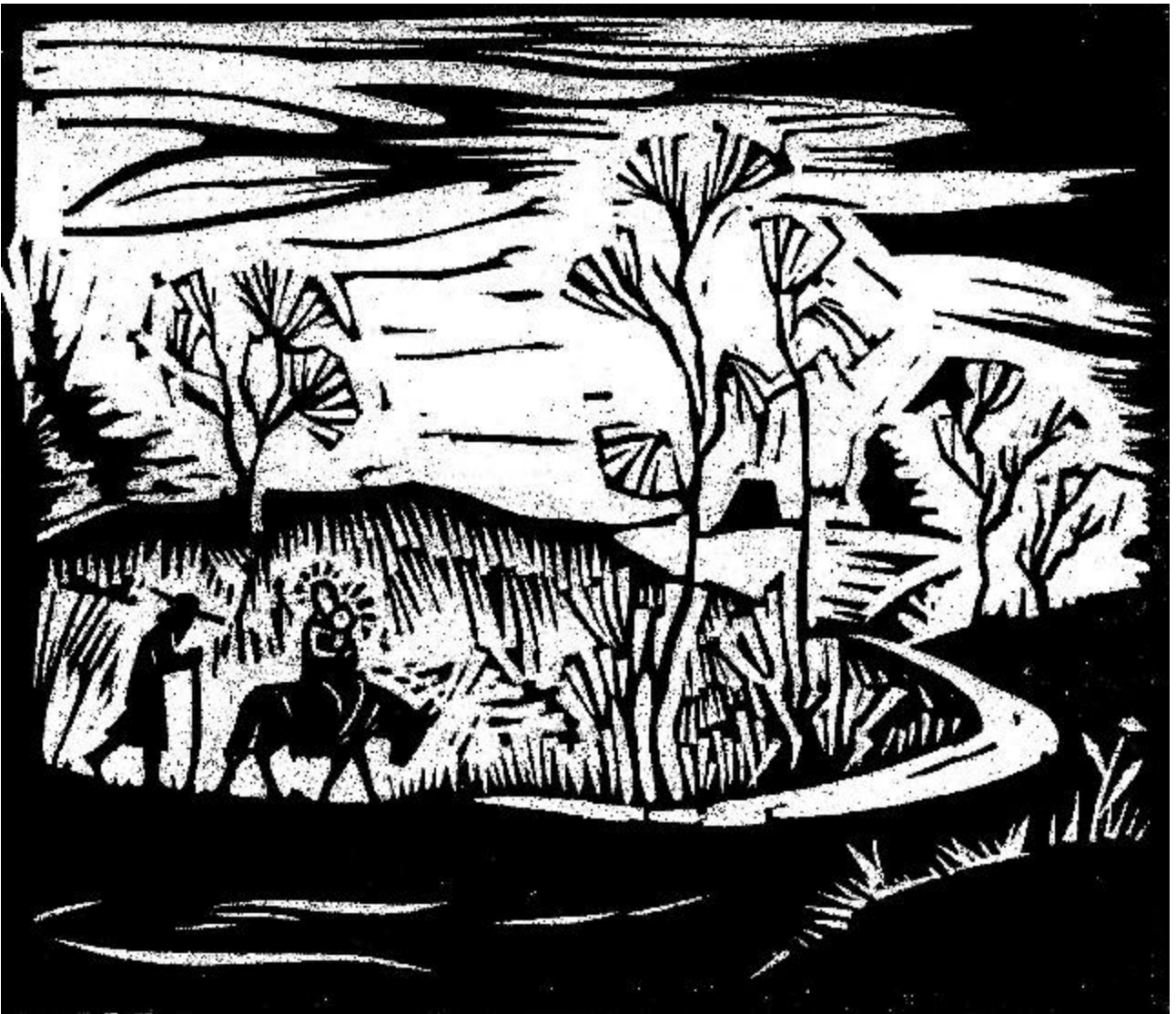
Flucht nach Ägypten, Holzschnitt