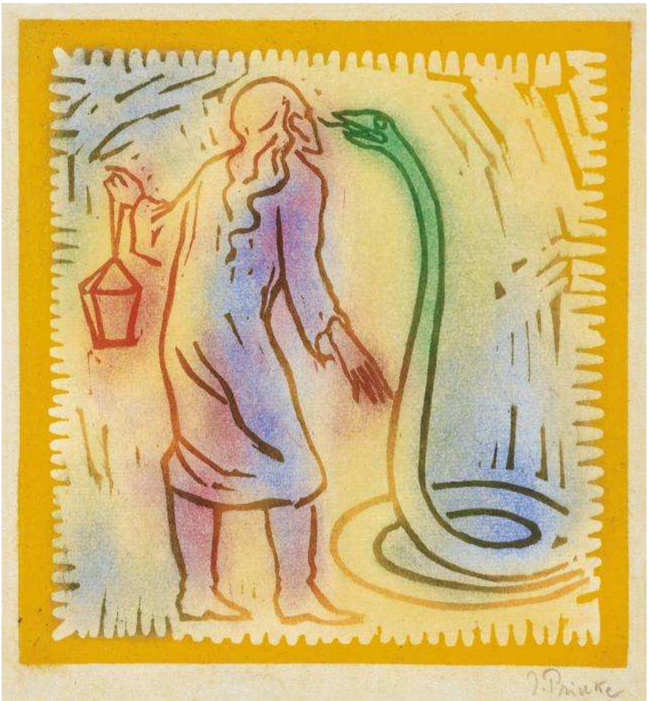
"Es ist an der Zeit" (Aus Goethes Märchen), Farbholzschnitt