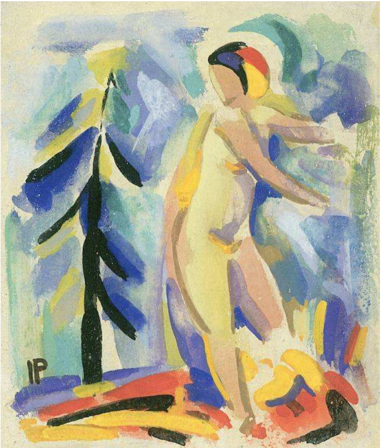
Figur mit Tanne, Wachstempere